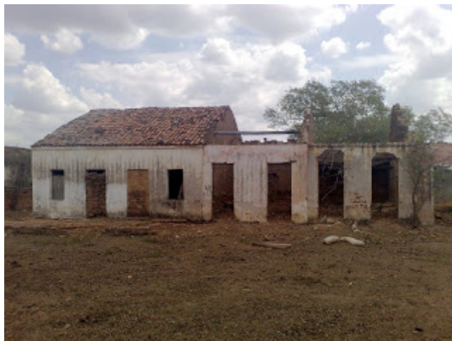
Ruínas do Cococi