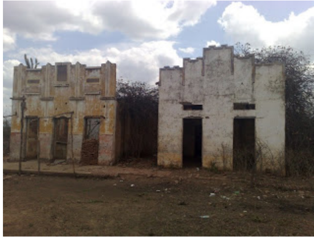
Ruínas do Hotel e a Câmara do Cococi