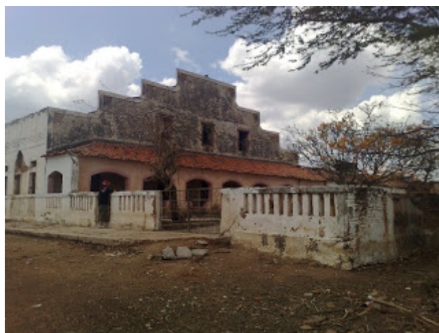
Antiga residência do Major Feitosa primeiro e último Prefeito do Cococi - foto Raimundo Soares