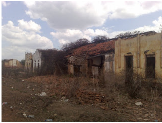
Ruínas do Cococi