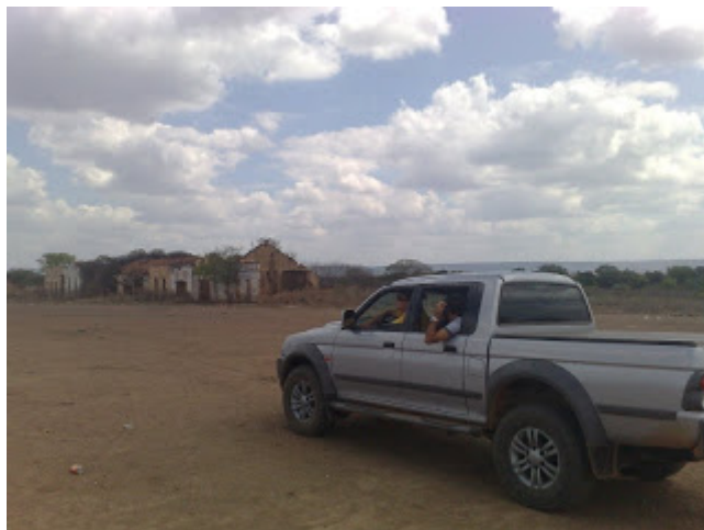
Entrada do Cococi - Orleans e Palito na camionete

Visitamos o Cococi em dezembro de 2009, confira as fotos: