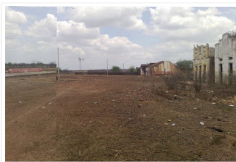
Avenida Central da antiga cidade de Cococi

Antigas casas marcam o início da colonização do Estado pelos Inhamuns, ainda no século XVIII, com a chegada da Família Feitosa na região. Algumas delas ainda resistem ao tempo. Outras, no entanto, estão completamente em ruínas.