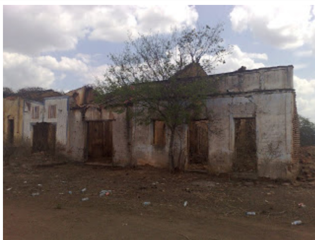
Ruínas do Cococi