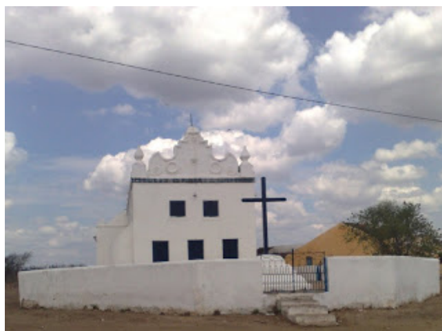
Capela de Nossa Senhora da Conceição, Padroeira do Cococi, restaurada pela família Feitosa